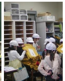
11月20日小学校2年生の生徒さんが生活科の授業で村檜会館の見学と自治会の仕事について学びました。とりわけ回覧板配布の仕組みについて興味深げでした。