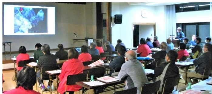
十一月十五日組長会で「こみ出し講習会」を行いました。