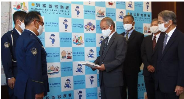
11月18日町民の皆さんから預かった交通安全宣言書を浜松西警察署に提出しました。「飲酒運転をしない、させない」「決められた速度を守る、守らせる」宣言を実行しましょう。