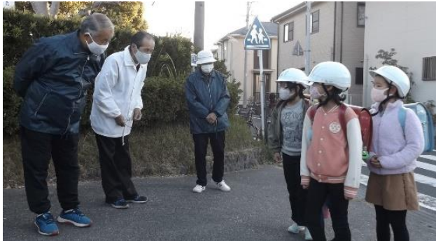
11月11日は「ひとりひとりにいい声かけデー」。小学校へ登校する子どもたちに、役員が「おはよう！」と声かけを行いました。

令和2年4月1日現在 人口 2,702人 男 1,330人 女 1,372人 世帯数 1,060戸